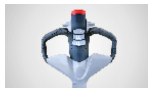
Figura 1 - Timão