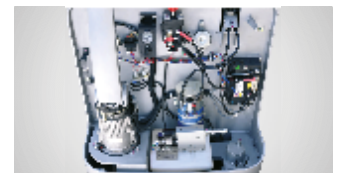
Figura 2 - Tração