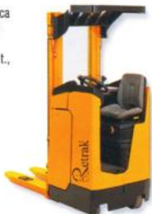
Empilhadeira Elétrica para operador sentado, capacidade até 1,6 t., altura de elevação até 5,2 m.