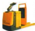
Horizontal, capacidade até 2,0 t., sel. de pedidos: até 2ª altura.