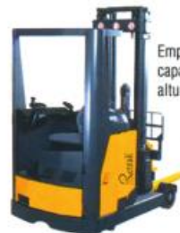
Empilhadeira Elétrica Retrátil, capacidade até 2 t., altura de elevação até 11,5 m.