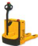
Transpaleteira Elétrica para operador a pé, capacidade até 2,0 t.