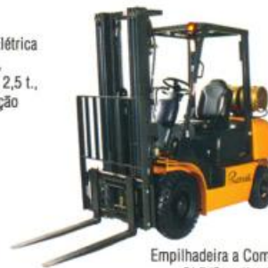
Empilhadeira a Combustão GLP/Gasolina/Diesel, capacidade até 5,0 t., altura de elevação até 7,0 m.