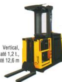
Vertical, capacidade até 1,2 t., sel. de pedidos: até 12,6 m