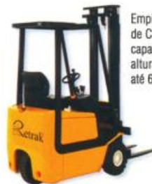
Empilhadeira Elétrica de Contrapeso, capacidade até 2,5 t., altura de elevação até 6,5 m.