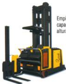
Empilhadeira Elétrica Trilateral, capacidade até 1,5 t., altura de elevação até 13,0 m.