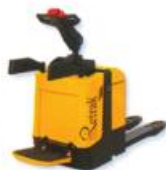
Transpaleteira Elétrica para operador a bordo, capacidade até 2,0 t.