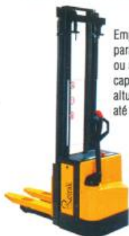
Empilhadeira Elétrica para operador a pé ou a bordo, capacidade até 1,6 t., altura de elevação até 5,4 m.